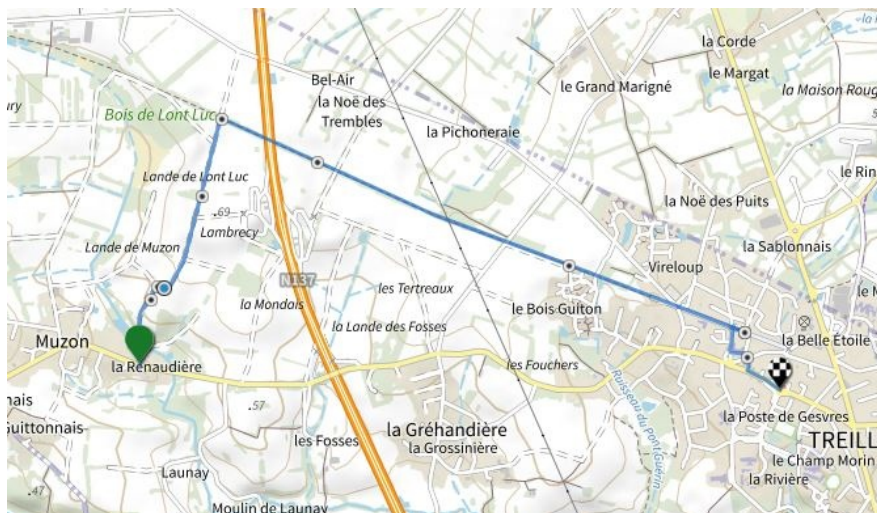
La Gréhandière - le Bourg, 1ère option 2.4 kms