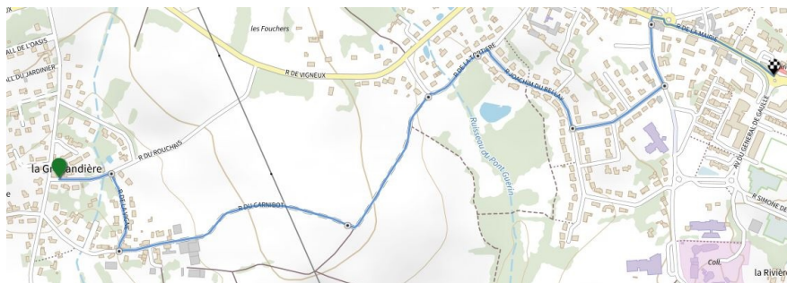
La Gréhandière - le Bourg, 2ème option 2.7 kms