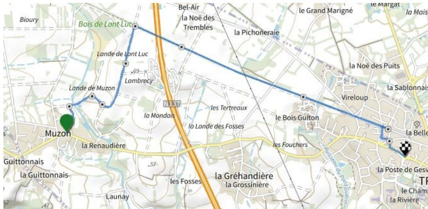
Muzon - le Bourg, 2ème option 4.7 kms