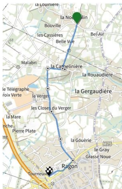
Muzon - le Bourg, 1ère option 5 kms